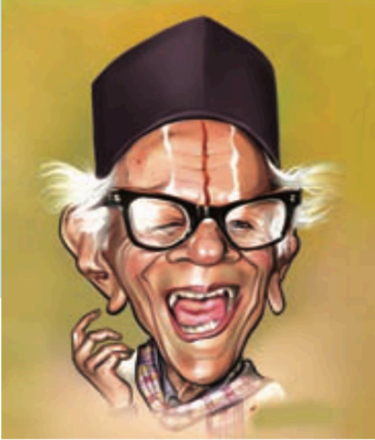
ಮಾಸ್ತಿ ವೆಂಕಟೇಶ ಅಯ್ಯಂಗಾರ್

ಕನ್ನಡದ ಆಸ್ತಿ ಮಾಸ್ತಿ ನಮ್ಮೆಲ್ಲರಿಗೂ ಆಶೀರ್ವಾದದ ನಗು ಹರಿಸುತ್ತಿದ್ದಾರೆ. ಶಿವರಾಮ ಕಾರಂತರು ಹೊತ್ತಗೆ ಹಿಡಿದು ಓದಲು ಕುಳಿತಿದ್ದಾರೆ. ಕಾದಂಬರಿಕಾರ್ತಿ ತ್ರಿವೇಣಿ ಹೊಸ ಬಗೆಯ ಕಥಾ ವಸ್ತುವಿನ ಹುಡುಕಾಟದಲ್ಲಿದ್ದಾರೆ. ಜಿ. ವೆಂಕಟಸುಬ್ಬಯ್ಯನವರು ಪುಸ್ತಕ ತೆರೆದು ಪದಗಳ ಅರ್ಥದ ಪಥ ತೋರಿಸುತ್ತಿದ್ದಾರೆ. ಚಂದ್ರಶೇಖರ ಕಂಬಾರರು ಹೊಸಕವಿಗಳಿಗೆ ಕಾವ್ಯಪಾಠ ಬೋಧಿಸುತ್ತಿದ್ದಾರೆ.